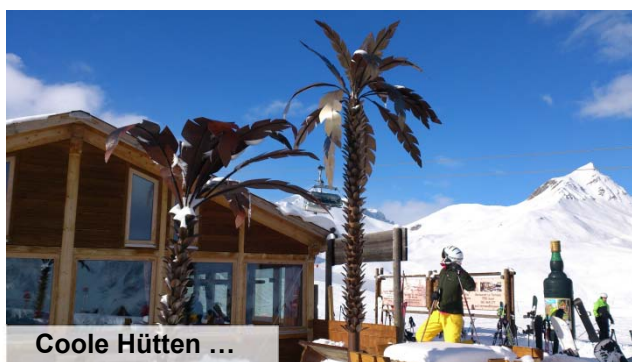
Coole Hütten ...

Das großartige Skigebiet bietet uns viele abwechslungsreiche Pisten für jedes Niveau und Möglichkeiten für weitere Schneesportarten wie Schneeschuhwandern, Skitouren und Schlitteln. Bade- und Wellnessfreunden steht im Ort die große Bäderlandschaft Bogn Engiadina Scuol zur Verfügung.